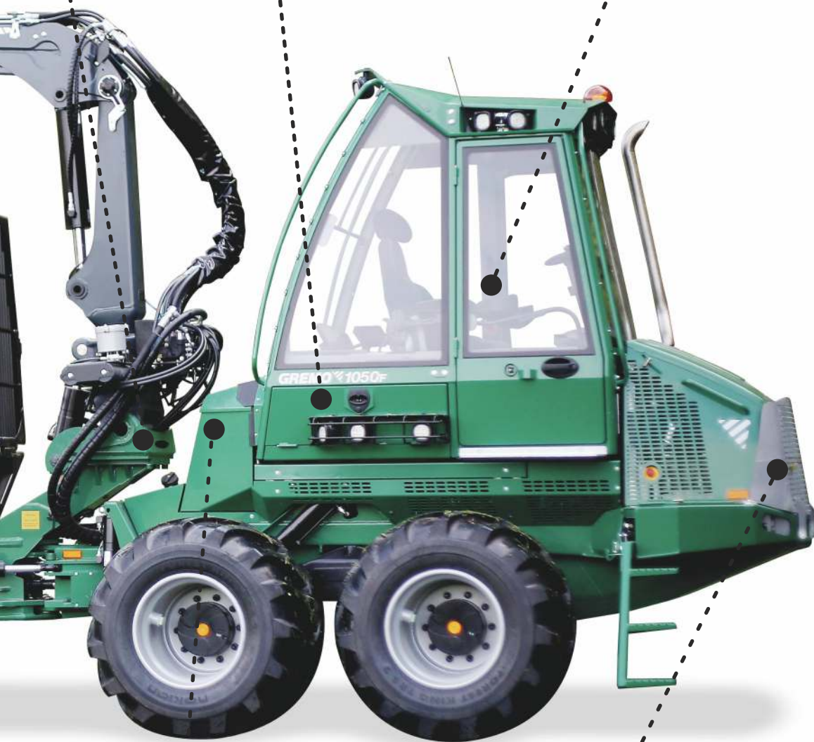
Autoamtické dopĺňanie nafty a oleja