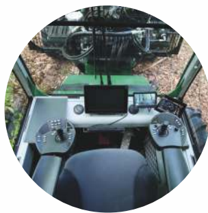
Neobmedzený výhľad z kabíny