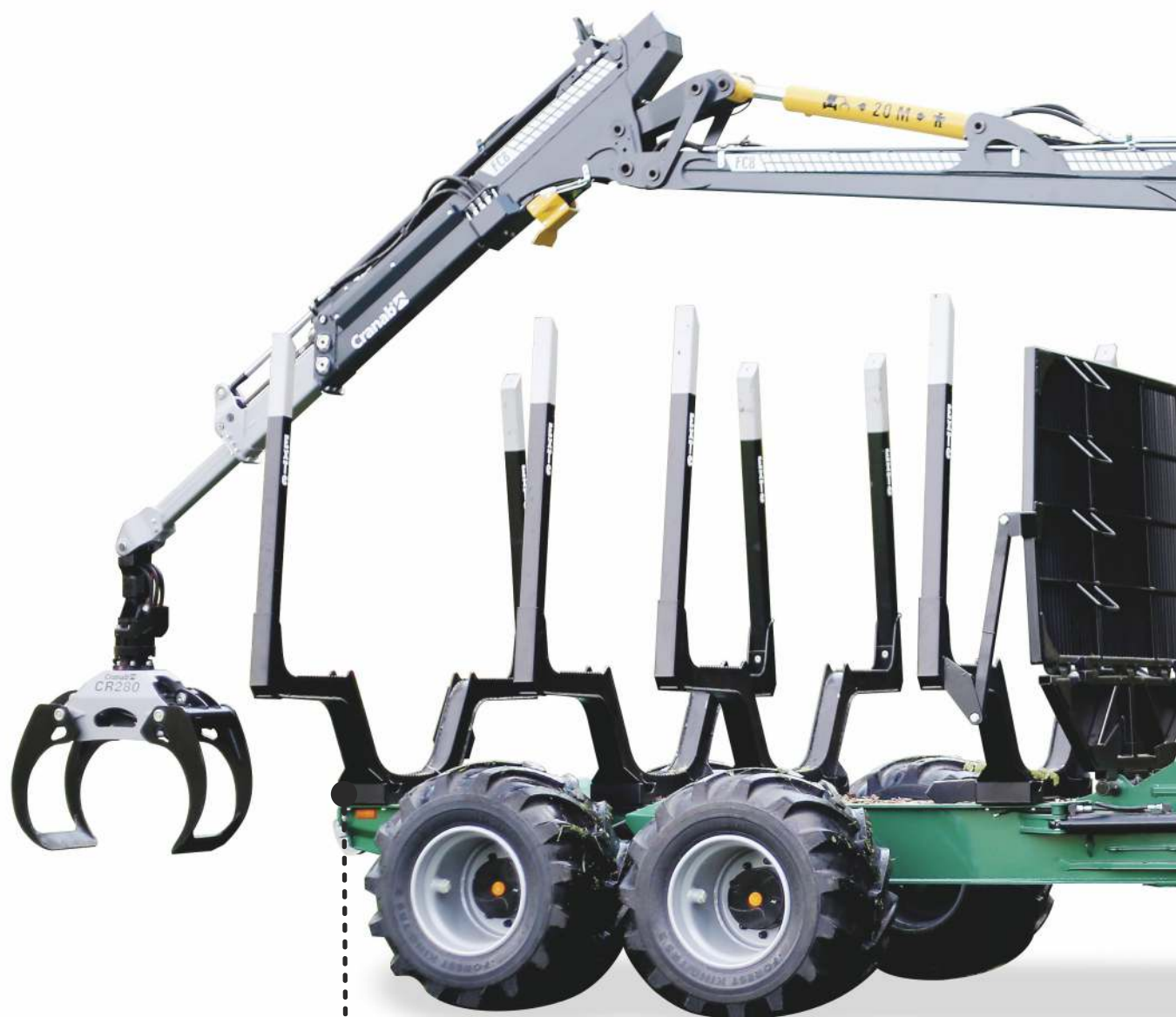
Integrované svetlá na bunkách výložníka