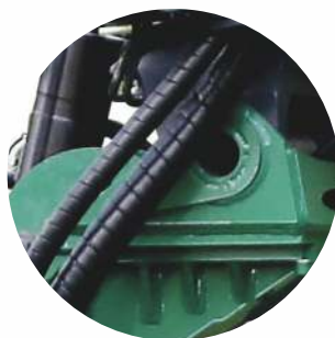
Integrované GREMO sklápánie hydraulického ramena (voliteľné)