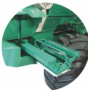
Vyhrievaný úložný priestor pre náradie v ľavej prednej časti