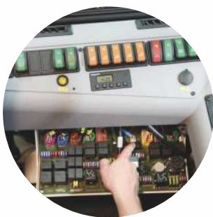
Poistková skrinka v kabíne